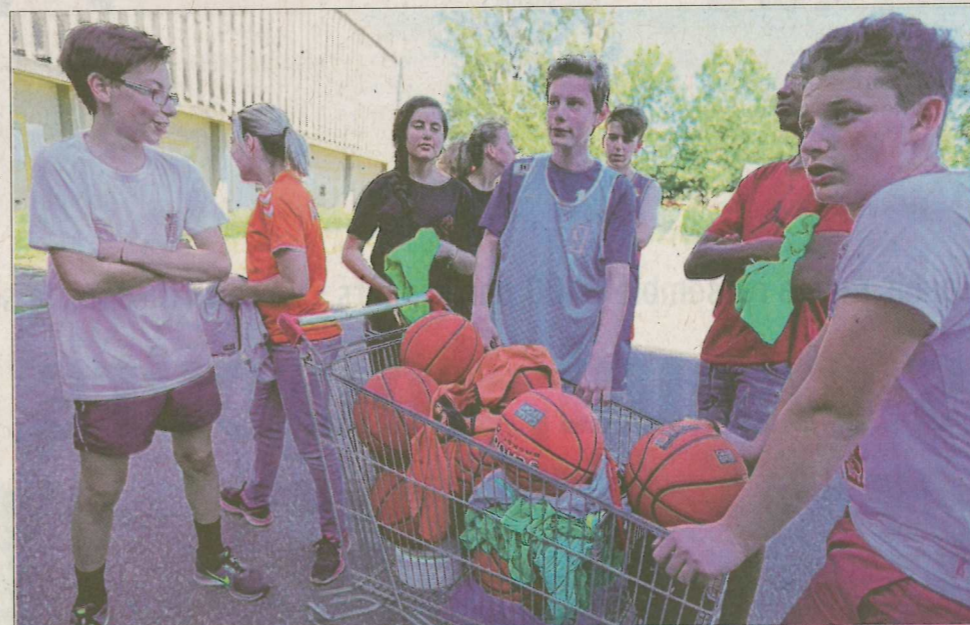
En juin, les premiers entraînements avaient lieu sur les terrains de la cité scolaire.